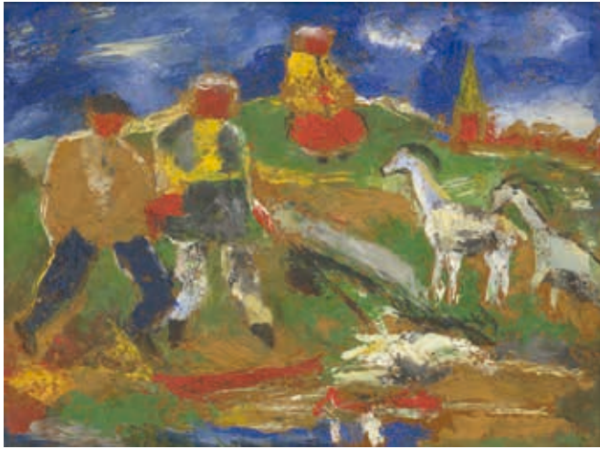
Menschen und Tiere · 1956 · Öl auf Hartfaser · 60 x 80 cm