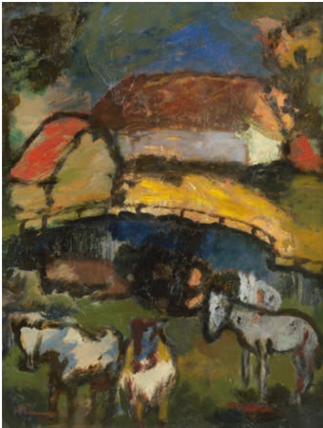
Morgen auf dem Lande · 1951 · Öl auf Hartfaser · 80 x 60 cm