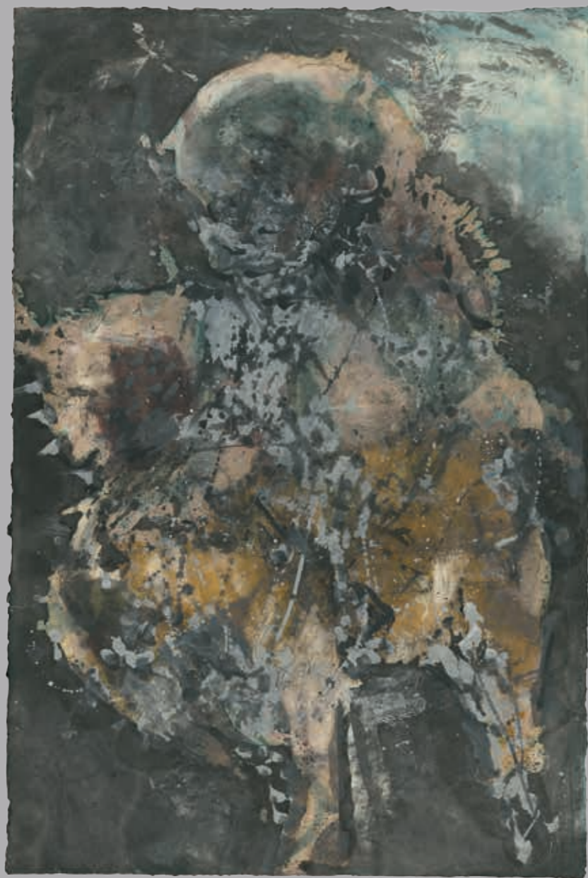
Zurück in die Nacht · 2006 · Beize, Aquarell und Tusche auf Japan