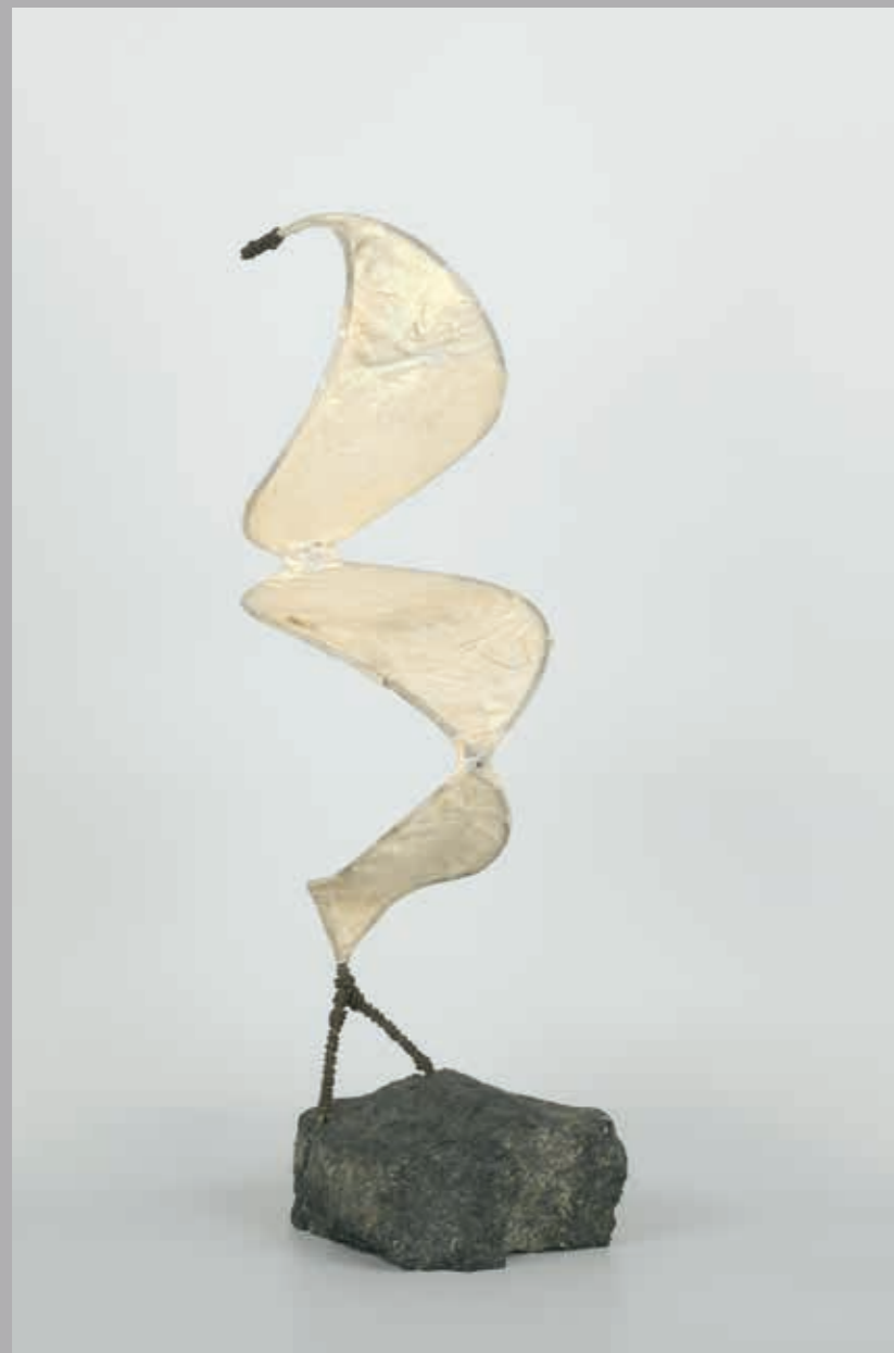
Ohne Titel · 2004 · Granit, Eisen, Papier