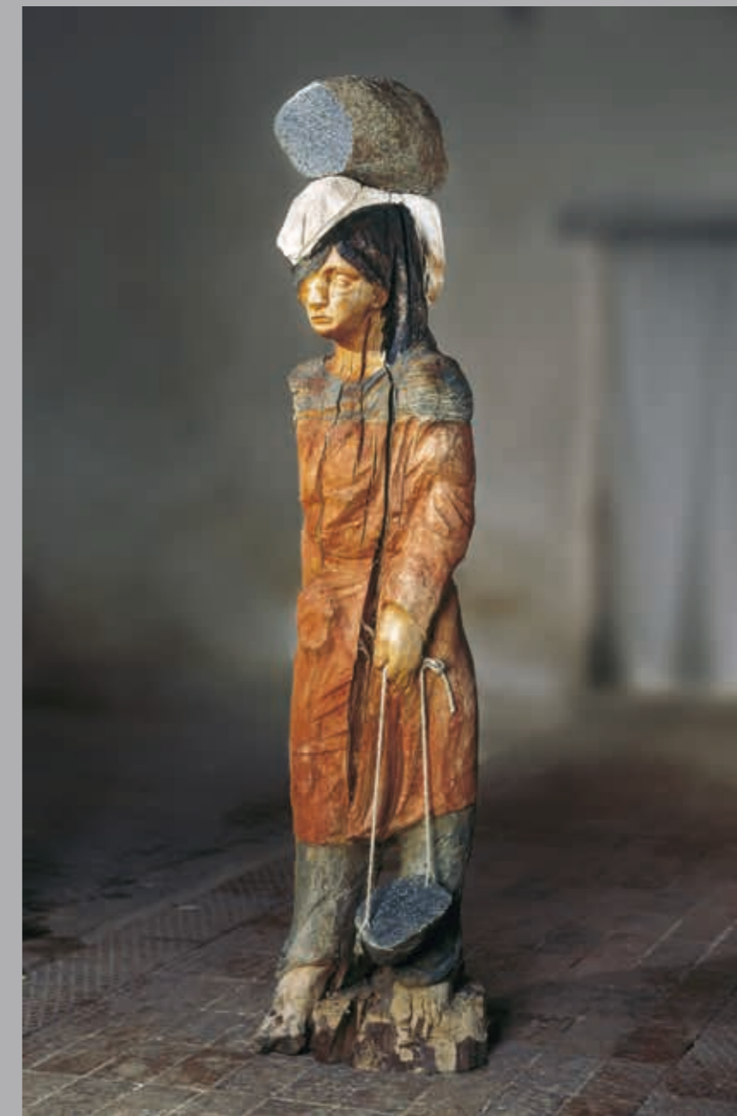
Balance · 2003 · Birnenholz, Granit, Schnur